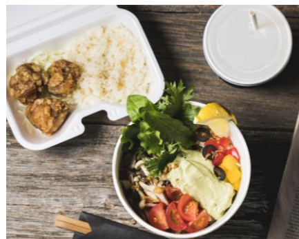
Bセット ラーメン+400円

お好きなラーメンにプラス300円（税別）で、-halfサイズのポテトとドリンクのセットを付けることが可能です。