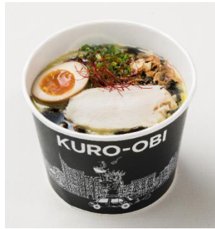
黒帯 (くろおび) 890 円

まろやかで濃厚な鶏白湯スープに太いちぢれ麺を合わせ、トッピングにしっとりとした鶏チャーシュー、半熟煮卵、ネギ、フライドオニオンチップを。さらに中央にのせた「辛みそ」溶かすことで辛味を楽しむこともできます。