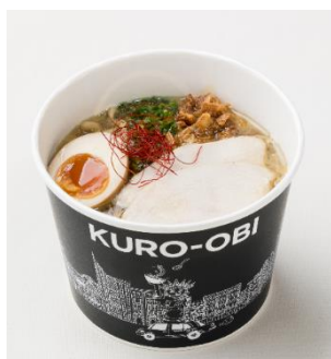
茶帯 (ちゃおび) 850 円

「白帯」に特製のラー油をプラス。まろやかな鶏清湯スープとピリ辛のラー油がバランス良く合わさります。