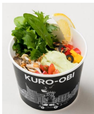
緑帯 (みどりおび) 990 円

鶏白湯ではなくすっきりとした鶏清湯(とりちんたん)スープのラーメン。麺は太いちぢれ麺を使用し、あっさりとしながらも食べ応えも充分。優しい味わいのラーメンです。