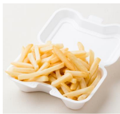
フライドチキン 430円

鶏肉をたっぷりと使った餃子。厚みのある皮を使用しておりジューシーで食べ応えある餃子に仕上げています。