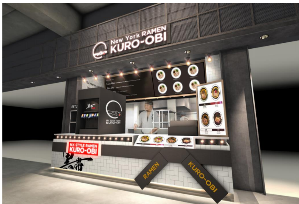
店舗外観イメージ

開業日 : 2020年8月4日（火） 店名 : 黒帯 MIYASHITA PARK 店 住所 : 東京都渋谷区神宮前 6-20-10 MIYASHITA PARK South3F FOOD HALL 内 営業時間 : 11:00～23:00（ラストオーダー22:30） 公式HP : https://kuroobi-ramen.com/ Instagram : https://www.instagram.com/kuroobi.ramen/ Facebook : https://www.facebook.com/kuroobi.ramen/