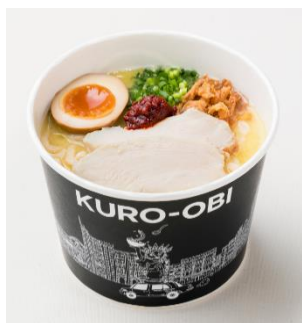
白帯 (しろおび) 830 円

まろやかで濃厚な鶏白湯スープに太いちぢれ麺を合わせ、トッピングにしっとりとした鶏チャーシュー、半熟煮卵、ネギ、フライドオニオンチップを。さらに中央にのせた「辛みそ」溶かすことで辛味を楽しむこともできます。