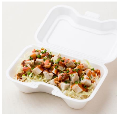
ケイジャンチキンライス 490円

日本限定メニュー。ゴロゴロにカットしたチキンに、アメリカお馴染みの激辛調味料「シラチャーソース」をかけたスパイシーな一品。ボリュームもあります。