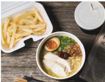
Aセット ラーメン+300円

ジンジャー味をつけて揚げた、少しスパイシーで大人な味の唐揚げです。おつまみとしてもおいしく召し上がっていただけます。