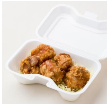
ジンジャー唐揚げ 390円

たっぷりと入っているので、複数名で分けながらつまむのにも適しています。ホクホクした食感を楽しめる、太めのポテトです。