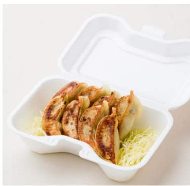
鶏餃子 8個 520円、 4個 390円

日本限定メニュー。ゴロゴロにカットしたチキンに、アメリカお馴染みの激辛調味料「シラチャーソース」をかけたスパイシーな一品。ボリュームもあります。