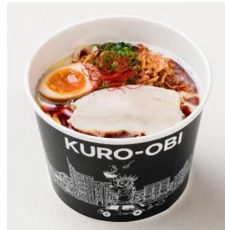
赤帯 (あかおび) 990 円

「白帯」にブラックペッパーを使ったコクのある黒い香油を、アクセントに追加しています。各国「黒帯」店舗の看板商品です。