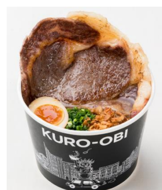
和牛ステーキラーメン 2,490 円

動物性食材不使用。パプリカやトマト、ベビーリーフなど数種類の野菜、炒ったキノコ、豆乳アボカドクリーム、黒オリーブのトッピングともちもちの中太麺をこれでもかという程によく混ぜ合わせて食べるのがコツです。途中でレモン汁を加えると風味が変わります。