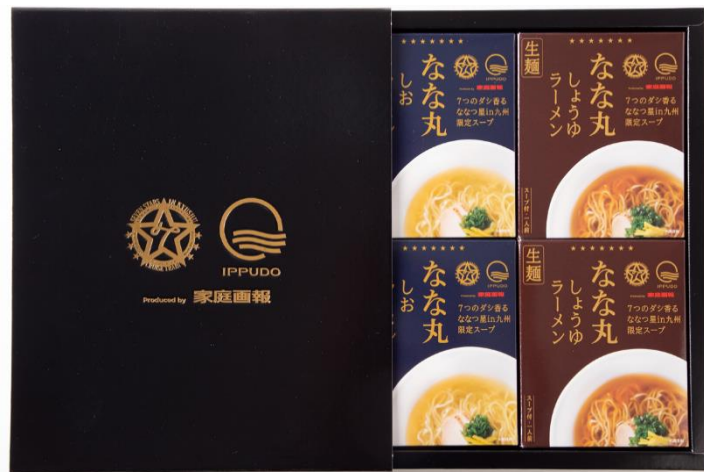
お届けする 「なな丸4食セット」 イメージ