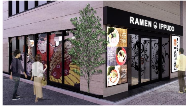
一風堂 浅草雷門通り店 外観イメージ

店名 : 一風堂 浅草雷門通り店 (イップウドウ アサクサカミナリモンドオリテン) 開業日 : 2025年1月31日(金) 住所 : 〒111-0032 東京都台東区浅草 1-6-2 Lang Hotel Asakusa 1 階 営業時間 : 11:00~22:30 (22:00 L.O.) 席数 : 20 席 占有面積 : 51.98 m 2 (15.70 坪) 駐車場 : なし 店舗ページ URL : https://stores.ippudo.com/1155