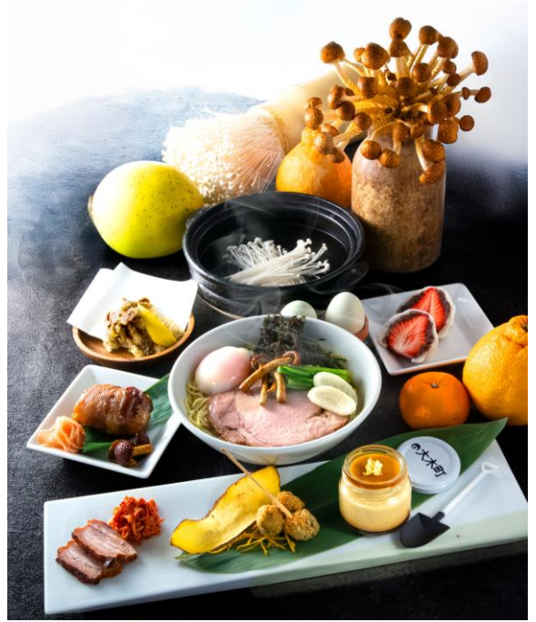
コース内容 イメージ