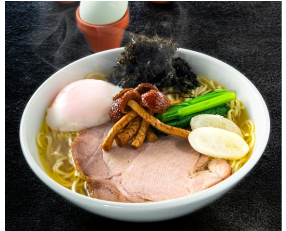
博多すぎたけの塩中華そば イメージ