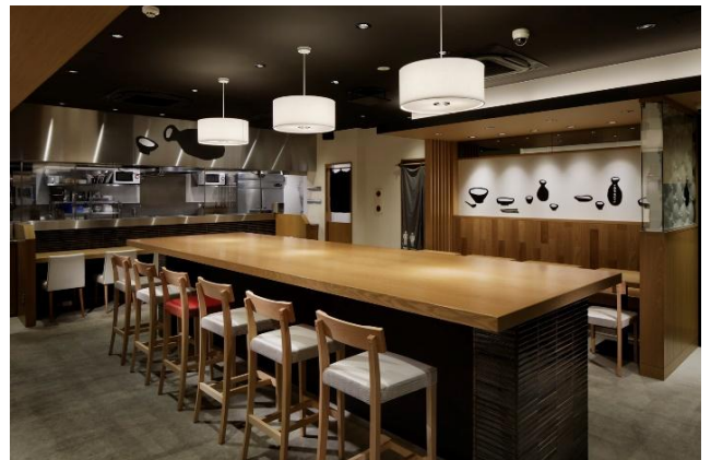
一風堂 浜松町スタンド 内観