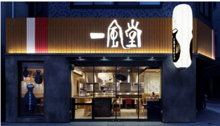
一風堂 浜松町スタンド 外観